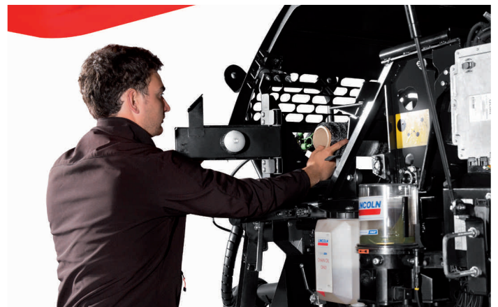
Paprasta pakeisti tinklą ar plėvelę