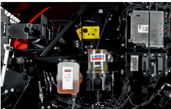
Centrinė tepimo sistema

Kairėje mašinos pusėje rasite visas hidraulinės sistemas. Kasdieninius patikrinimus ir visus reikalingus pakeitimus atliksite greičiau ir lengviau. Hidraulinė ir centrinio tepimo sistemos